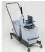
KIT CON PRENSA VERTICAL 25L+9L

REF:7802 Formato: Marca: VILEDA UD/CAJA: