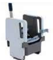
PRENSA VERTICAL MOCHO

REF:7830 Formato: Marca: VILEDA UD/CAJA: