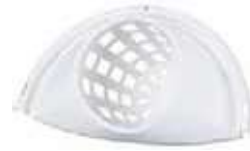
ESCURRIDOR PARA CUBO DE 13L

REF:7378 Formato:29X15X12cm Marca: AMAPOLA UD/CAJA:24