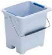
CUBO ULTRASPEED PRO 9L

REF:39080007 Formato:9L Marca: VILEDA UD/CAJA:10