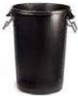
CUBO BASURA NEGRO SIN TAPA 100L

REF:36065 Formato:50X50X65cm Marca: AMAPOLA UD/CAJA:6