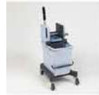
KIT 25L CON PRENSA VERTICAL

REF:39080004 Formato: Marca: VILEDA UD/CAJA: