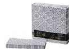
SERV. 40X40 1CP KANGUR SIENA GRIS

REF:32110012 Formato:50uds Marca: G. CLASS UD/Caja: