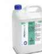
DESINC. HIGIEN.MIX P 43

REF:9158 Formato:5L Marca: PRODER UD/CAJA:3