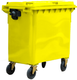
CONT.C/TAPA AMARILLO 4 RUEDAS

REF:75990056 Formato:1.100L Marca: MAYA UD/CAJA: