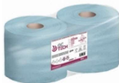
BOBINA MULTIUSOS IND. AZUL 2CP. 1212/400

REF:41434 Formato:23x400m Marca: G.C UD/CAJA:2