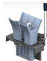
PRENSA ULTRASPEED MOPA

REF:7668 Formato: Marca: VILEDA UD/CAJA:8