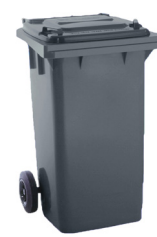
CONT. C/TAPA GRIS 2 RUEDAS

REF:75990171 Formato:120L Marca: MAYA UD/CAJA: