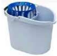
CUBO C/ESCURRIDOR 10L

REF:41021 Formato:10 L Marca: VILEDA UD/CAJA:12