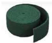
ESTROPAJO ROLLO VERDE ABRASIVO

REF:7610 Formato:14X6m Marca: VILEDA UD/CAJA:6