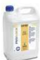
LIMPIADOR JABON FLOOR PARKET

REF:9164 Formato:5L Marca: PRODER UD/CAJA:3