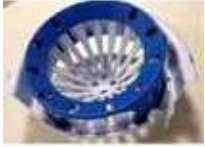
ESCURRIDOR PARA CUBO DE 10L

REF:39080003 Formato: Marca: VILEDA UD/CAJA:12