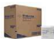
TOALLA BAYETA PAQ.1/4 P-56 D

REF:7102 Formato:30X32cm Marca: WYPALL L40 UD/CAJA:18