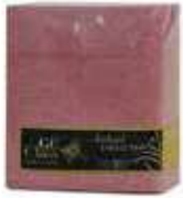
SERV. 33X40 1CP KANGUR BURDEOS FILUM

REF:32110016 Formato:50uds Marca: G. CLASS UD/Caja: