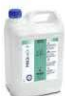
FRIEGASUELOS NEUTRO MIX P42

REF:9211 Formato:5L Marca: PRODER UD/CAJA:3