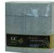
SERV.40X40 1CP KANGUR GRAFITO FILUM

REF:32110015 Formato:50uds Marca: G. CLASS UD/Caja:12