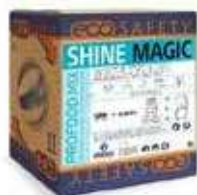
ABRILLANTADOR SHINE MAGIC.

REF:9280 Formato:5L Marca: PRODER UD/CAJA: