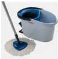
KIT ULTRA SPIN

REF:39080012 Formato: Marca: VILEDA UD/CAJA: