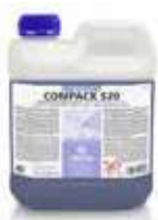
ABRILLANTADOR COMPACK S20

REF:55040002 Formato:2L Marca: PRODER UD/CAJA:4