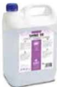
ABRILLANTADOR AB SHINE 10

REF:9291 Formato:20L Marca: PRODER UD/CAJA: