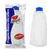
FREGONA MICROF. S/DELICADA 160gr

REF: 7411 Formato:30cm Marca: AMAPOLA UD/Caja:18