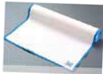
ROLLO ROLL-DRAP ALG.F/BLANCO-AZUL

REF: 7326 Formato: 40x64cm Marca: ROLL DRAP UD/Caja: 20