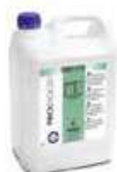
FREGAS. CLORADO DESINF. EXTRA

REF:9121 Formato:5L Marca: PRODER UD/CAJA:13