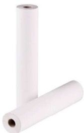
ROLLO CAMILLA 2CP ECO PRECORT. 2 m 40 SERV.

REF:45013 Formato:80m Marca: G.C UD/CAJA:6