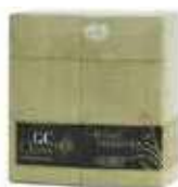
SERV.40X40 1CP KANGUR ORO FILUM

REF:32110029 Formato:50uds Marca: G. CLASS UD/Caja:12