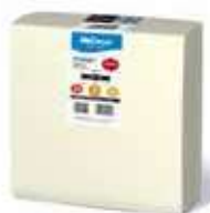
SERV. 40X40 1CP 1/4 DELUXE CREMA

REF:32110026 Formato:40uds Marca: HODECOR UD/Caja:10