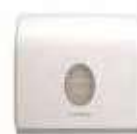
DISPENSADOR TOALLA 1 CLIP

REF:11018 Formato:15,9X28,7X14,2 Marca: AQUARIUS UD/CAJA: