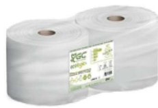
BOBINA MULTIUSOS IND. 2CP ECO 1714/600 P2

REF:41435 Formato:1ud Marca: G.C UD/CAJA:2