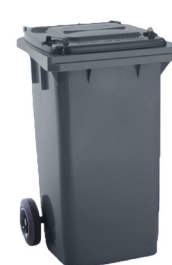
CONT. C/TAPA GRIS 2 RUEDAS

REF:75990377 Formato:240L Marca: MAYA UD/CAJA: