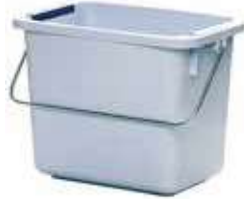
CUBOS DE 6L + 6 CLIPS

REF:41022 Formato:27,8X17,6X21,6 Marca: VILEDA UD/CAJA:10