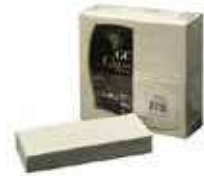
SERV. 40X40 1CP 1/8 T-SEC KANGUR CAMEL

REF:32010012 Formato:50uds Marca: G. CLASS UD/Caja:12