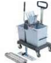
KIT DOBLE ULTRASPEED PRO 25L+9L

REF:39080006 Formato:60X38cm Marca: VILEDA UD/CAJA: