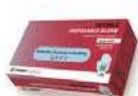
GUANTES NITRILO S/P T/XG AZUL

REF: 39060040 Formato:100uds Marca: UD/Caja:10