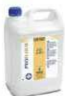
DETERG.FREGAD.S/ESP FLOOR MACSTRONG

REF:9178 Formato:5L Marca: PRODER UD/CAJA:3