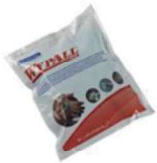
RECAMBIO PAÑOS IMPREGNADOS. S

REF:7939 Formato:1X75 paños Marca: WYPALL UD/CAJA:6