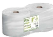
BOBINA MULTIUSOS IND. 1CP ECO 2857/1000 P2

REF:41436 Formato:2 ROLLOS Marca: G.C UD/CAJA:2