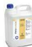
FREGAS. LAVICERA FLOOR WAX

REF:9163 Formato:5L Marca: PRODER UD/CAJA:3