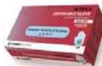
GUANTES NITRILO S/P T/P AZUL

REF: 39060037 Formato:100uds Marca: UD/Caja:10