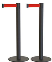
POSTE CON CINTA EXTENS. 2 m-CATENARIAS

REF:75990233 Formato: Marca: GALINDO UD/CAJA: