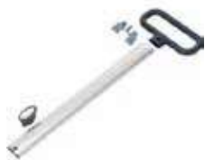
ULTRASPEED PRO BARRA EMPUJE

REF:39120014 Formato: Marca: VILEDA UD/CAJA: