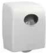
DISPENSADOR NO-TOUCH BCO 350m

REF:41060011 Formato:1ud Marca: AQUARIUS UD/CAJA: