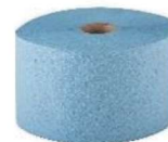
BOBINA MULTIUSOS IND. AZUL 3CP. 750/285m

REF:40010003 Formato:23x285m Marca: GC UD/CAJA:2