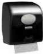
DISPENSADOR NO-TOUCH NEGRO 350m

REF:41060012 Formato:1ud Marca: AQUARIUS UD/CAJA: