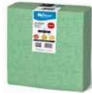
SERV. 40X40 1CP 1/4 DELUXE VERDE

REF:32110025 Formato:40uds Marca: HODECOR UD/Caja:10