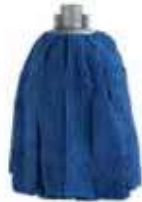
FREGONA MICROFIBRA TIRAS

REF: 39040007 Formato:170gr Marca: MAYA UD/Caja:24