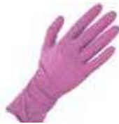
GUANTE LATEX GRUESO ROSA T/M

REF: 601 Formato: 10x10 pares Marca: SPONTEX UD/Caja: 100