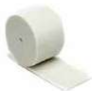
ESTROPAJO ROLLO BLANCO

REF:7486 Formato:15X6m Marca: RESSOL UD/CAJA:12