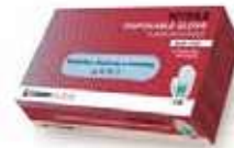
GUANTES NITRILO S/P T/G AZUL

REF: 39060039 Formato:100uds Marca: UD/Caja: 10