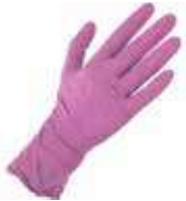
GUANTE LATEX GRUESO ROSA. T/G

REF: 602 Formato: 10x10 pares Marca: SPONTEX UD/Caja: 100