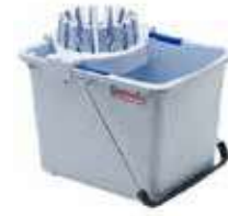
CUBO C/ESCURRIDOR 15L

REF:7670 Formato:15 L Marca: VILEDA UD/CAJA:10