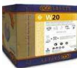
LAVAV. MAQ. AM ECOSAFETY W20

REF:9194 Formato:10L Marca: PRODER UD/CAJA: