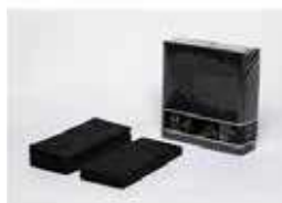
SERV. 40X40 1CP 1/8 T-SEC KANGUR NEG. SIDNEY

REF:32010020 Formato:50uds Marca: G. CLASS UD/Caja:12