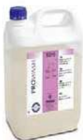
WASH 20 CLOR

REF:9270 Formato:20L Marca: PRODER UD/CAJA: