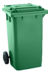
CONT. C/TAPA VERDE 2 RUEDAS

REF:75990060 Formato:120L Marca: MAYA UD/CAJA: