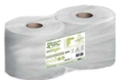
BOBINA MULTIUSOS IND. 2CP RCL 1212/400 m

REF:45002 Formato:23x400m Marca: G.C UD/CAJA:2