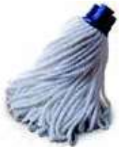
FREGONA MICROFIBRA EXTRA

REF: 7425 Formato:160gr Marca: CLEVERNET UD/Caja:30