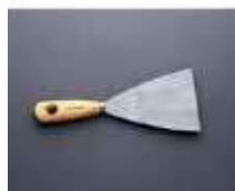
ESPATULA 20UD X12 PAQ. GRANDE

REF:7194 Formato:10cm Marca: BARBOSA UD/CAJA:240