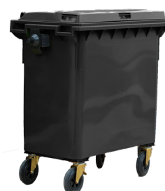
CONT.C/TAPA GRIS 4 RUEDAS

REF:75990155 Formato:800L Marca: MAYA UD/CAJA: