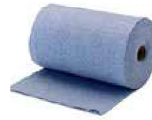
BAYETA ROLLO PUNTO AZUL

REF: 7389 Formato: 3mts Marca: AMAPOLA UD/Caja: 6