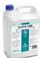
FREGAS. PERFUM.GRAL. CLEAN GEN

REF:9128 Formato:5L Marca: PRODER UD/CAJA:3