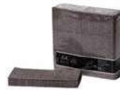
SERV. 40X40 1CP 1/8 T-SEC KANGUR CACAO FILUM

REF:32010038 Formato:50uds Marca: G. CLASS UD/Caja:12