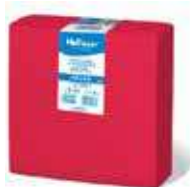
SERV. 40X40 PP 1/4 ROJO

REF:32140037 Formato:50uds Marca: HODECOR UD/Caja:36