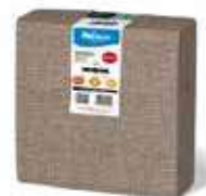
SERV. 40X40 PP 1/4 DELUXE CACAO

REF:32110027 Formato:40uds Marca: HODECOR UD/Caja:10