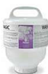
WASH MAGIC XL

REF:9279 Formato:4,5kg Marca: PRODER UD/CAJA: