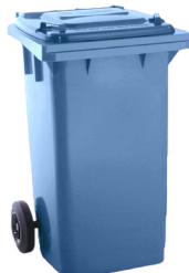
CONT. C/TAPA AZUL 2 RUEDAS

REF:75990355 Formato:240L Marca: MAYA UD/CAJA: