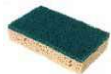
ESTROPAJO VERDE CON ESPONJA

REF:7800 Formato:9,5X16,3 Marca: VILEDA UD/CAJA:144