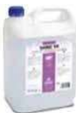
ABRILLANTADOR AB SHINE 10

REF:9290 Formato:5L Marca: PRODER UD/CAJA:3