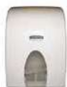
DISPENSADOR DUAL TOALLAS

REF:7032 Formato:41X29X25 Marca: KIMBERLY UD/CAJA: