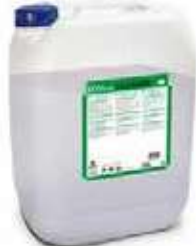
ABRILLANTADOR UNIV. FOR SHINE

REF:9106 Formato:20L Marca: FORTEX UD/CAJA: