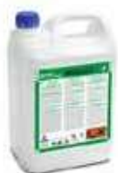
DETERG. DESINF. RESIDUAL HIGICUAT

REF:9142 Formato:5L Marca: PRODER UD/CAJA:3