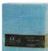
SERV.40X40 1CP 1/8 T-SEC KANGUR TURQUESA FILUM

REF:32110031 Formato:50uds Marca: G. CLASS UD/Caja:12