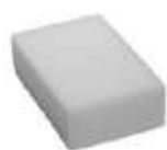
ESPONJA MIRACLEAN 100X60X28

REF:7779 Formato:10x6cm Marca: VILEDA UD/CAJA:144