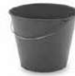
CUBO AGUA PLT AZUL 6 L

REF:7341 Formato:25,5X23,5X17,5cm Marca: AMAPOLA UD/CAJA:24