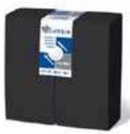
SERV. 40X40 PP 1/8 NEGRO

REF:32140051 Formato:50uds Marca: QUALQUE UD/Caja:36