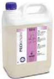
LAVAV. MAQ.A.D CONCENT.WASH 45

REF:91157 Formato:20L Marca: PRODER UD/CAJA: