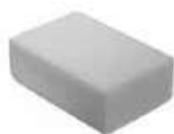
ESPONJA MIRACLEAN 120X75X39

REF:7612 Formato:12x7cm Marca: VILEDA UD/CAJA:96