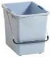
CUBO ULTRASPEED RECT. AZUL 25L

REF:7669 Formato:25L Marca: VILEDA UD/CAJA:10