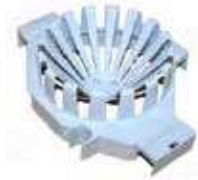
ESCURRIDOR PARA CUBO 15/25 L

REF:7814 Formato: Marca: VILEDA UD/CAJA:10