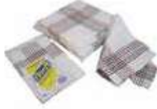
PAÑO COCINA BLANCO SARGA

REF: 7393 Formato: 45x45cm Marca: UD/Caja: 15 packs