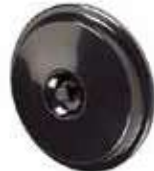
TAPA CUBO BASURA NEGRO 100 L

REF:36066 Formato:51X51X6cm Marca: AMAPOLA UD/CAJA:6