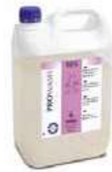
LAVAV. MAQ. A.SD.CONCENT.WASH 45

REF:91104 Formato:5L Marca: PRODER UD/CAJA:3