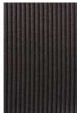
ROLLO SECAVASOS ABSORVENTE NEGRO

REF: 39010010 Formato: 300X65Cm Marca: AMAPOLA UD/Caja: 6