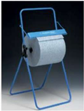
PORTABOBINAS MOVIL PIE FIJO. S

REF:7578 Formato:96X51X54 Marca: KIMBERLY UD/CAJA: