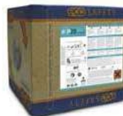
ABRILLANTADOR AM ECOSAFETY S20

REF:9195 Formato:10L Marca: PRODER UD/CAJA: