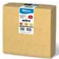
SERV. 40X40 1CP 1/4 DELUXE MOSTAZA

REF:32110028 Formato:40uds Marca: HODECOR UD/Caja:10