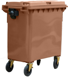
CONT. C/TAPA MARRÓN 4 RUEDAS

REF:75990058 Formato:800L Marca: MAYA UD/CAJA: