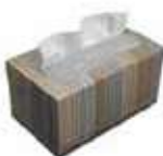
TOALLA INTERP. CAJA POP-UP

REF:7993 Formato:P-70 Marca: KLEENEX UD/CAJA:18