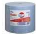
PAÑOS BOBINA AZUL

REF: 39010004 Formato: 1X870 Marca: WYPALLX70 UD/Caja: