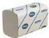
TOLLA INT.21,5X31,8 P-124 D

REF:41030022 Formato: Marca: KLEENEX UD/CAJA:15