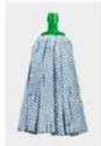
FREGONA TIRAS ESTANDAR

REF: 7449 Formato:27cm Marca: VILEDA UD/Caja:24