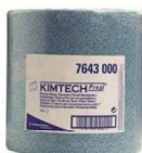
BOBINA AZUL BAYETA 36cmx85g D

REF:7559 Formato:1X500 serv Marca: KIMTECH UD/CAJA: