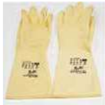
GUANTES SATINADOS GRUESOS T/7-M

REF: 654 Formato: 1 par Marca: SPONTEX UD/CAJA: 100