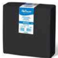
SERV. 40X40 PP 1/4 NEGRO

REF:32140035 Formato:50uds Marca: HODECOR UD/Caja:36