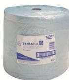
BOBINA AZUL 33cmx20g D

REF:7557 Formato: 1X670serv Marca: WYPALL UD/CAJA: