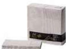
SERV. 40X40 PP 1/8 T-SEC KANGUR STONE FILUM

REF:32010043 Formato:50uds Marca: G. CLASS UD/Caja:12