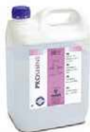
ABRILLANTADOR AM SHINE 20

REF:9108 Formato:20L Marca: PRODER UD/CAJA: