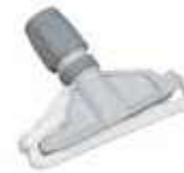
PINZA FREGONA PLÁSTICO

REF: 7749 Formato: 14cm Marca: VILEDA UD/Caja:10