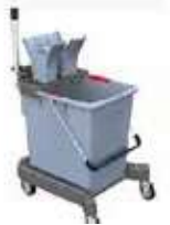
KIT COMP.ULTRASPEED PRO 25L

REF:7614 Formato:48X48X84 Marca: VILEDA UD/CAJA: