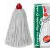
FREGONA ALGODÓN 225gr

REF: 7398 Formato:32cm Marca: AMAPOLA UD/Caja:24