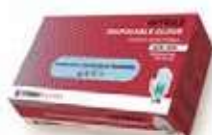
GUANTES NITRILO S/P T/M AZUL

REF: 39060038 Formato:100uds Marca: UD/Caja:10