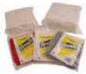
PAÑO TRAPO REJILLA BLANCO PACK-12

REF: 7387 Formato: 38X34cm Marca: PICO-TEX UD/Caja: 30 packs