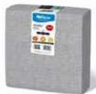
SERV.40X40 1CP 1/4 DELUXE ANTRACITA

REF:32110021 Formato:40uds Marca: HODECOR UD/Caja:10