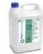
ANTICAL BAÑOS MIX P 60

REF:9148 Formato:5L Marca: PRODER UD/CAJA:12