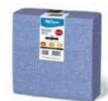
SERV. 40X40 PP 1/4 DELUXE AZUL

REF:32110023 Formato:40uds Marca: HODECOR UD/Caja:10