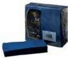
SERV.40X40 1CP 1/8 T-SEC KANGUR AZUL OSC.

REF:32010040 Formato:50uds Marca: G. CLASS UD/Caja:12