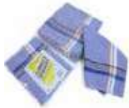
PAÑO COCINA AZUL ESPECIAL Pack-12

REF: 7392 Formato: 45x45cm Marca: UD/Caja: 15 paks