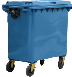
CONT. C/TAPA AZUL 4 RUEDAS

REF:75990055 Formato:1.100L Marca: MAYA UD/CAJA: