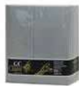
SERV. 40X40 1CP KANGUR GRIS

REF:32110020 Formato:50uds Marca: G. CLASS UD/Caja: