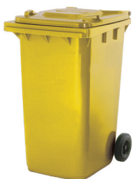
CONT. C/TAPA AMARILLO 2 RUEDAS

REF:75990354 Formato:240L Marca: MAYA UD/CAJA: