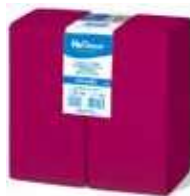
SERV. 40X40 PP 1/8 BURDEOS

REF:32140052 Formato:50uds Marca: HODECOR UD/Caja:36