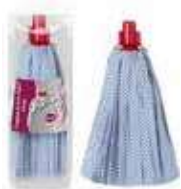
FREGONA TIRAS AZUL

REF: 7399 Formato:31cm Marca: AMAPOLA UD/Caja:24