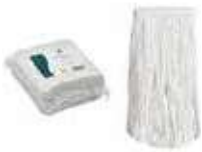
FREGONA INDUST.ALGODÓN 250gr

REF: 39040010 Formato:250g Marca: AMAPOLA UD/Caja:24