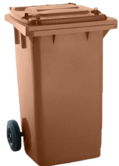
CONT. C/TAPA MARRÓN 2 RUEDAS

REF:75990059 Formato:120L Marca: MAYA UD/CAJA: