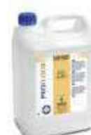
MULTIUSOS BIOALCOHOL MIX P41

REF:9147 Formato:5L Marca: PRODER UD/CAJA:3