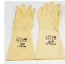
GUANTES SATINADOS GRUESOS T/8-G

REF: 655 Formato: 1 par Marca: SPONTEX UD/CAJA: 100