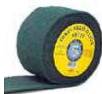
ESTROPAJO ROLLO VERDE EXTRA

REF:7403 Formato:15X6m Marca: PICO-TEX UD/CAJA:12