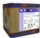
ANTICAL BAÑOS ECOSAFETY P 60

REF:9156 Formato:10L Marca: PRODER UD/CAJA: