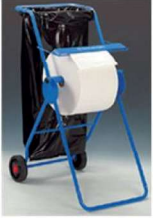
PORTABOBINAS MOVIL PIE. S

REF:7096 Formato:109X50X74 Marca: KIMBERLY UD/CAJA: