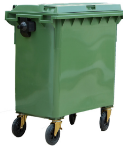
CONT.C/TAPA VERDE 4 RUEDAS

REF:75990057 Formato:1.100L Marca: MAYA UD/CAJA: