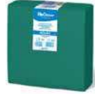
SERV. 40X40 PP 1/4 VERDE

REF:32140040 Formato:50uds Marca: HODECOR UD/Caja:36