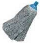
FREGONA PROF. ESTÁNDAR AZUL

REF: 7475 Formato:31cm Marca: VILEDA UD/Caja:24