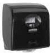
DISPENSADOR SLIMROLL NEGRO 190m

REF:41060014 Formato:1ud Marca: AQUARIUS UD/CAJA: