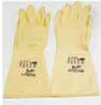
GUANTES SATINADOS GRUESOS T/6 P

REF: 653 Formato: 1 par Marca: SPONTEX UD/CAJA: 100