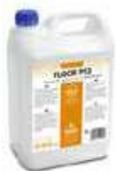
FREGAS. NEUTRO PERFUM.FLOOR

REF:9141 Formato:5L Marca: PRODER UD/CAJA:3