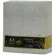
SERV. 33X40 1CP KANGUR STONE

REF:3010049 Formato:50uds Marca: G. CLASS UD/Caja: