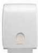
DISPENSADOR TOALLA PLEGADA D

REF:11017 Formato:40,7X31,7X14,7 Marca: AQUARIUS UD/CAJA: