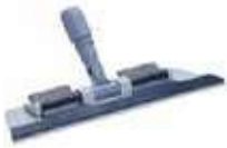
SOPORTE CLICKSPEED GRIS

REF: 41345 Formato:40cm Marca: VILEDA UD/Caja:10