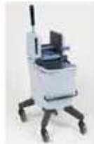
CUBO FREGADO PROFESIONAL

REF:41337 Formato: 25L Marca: VILEDA UD/CAJA: