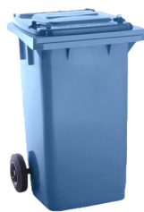
CONT. C/TAPA AZUL 2 RUEDAS

REF:75990041 Formato:120L Marca: MAYA UD/CAJA: