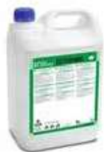
ABRILLANTADOR UNIV. FOR SHINE

REF:9105 Formato:5L Marca: FORTEX UD/CAJA:3