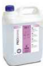
ABRILLANTADOR AM SHINE 20

REF:9107 Formato:5L Marca: PRODER UD/CAJA:3