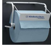
PORTABOBINAS MURAL/SOBREM. S

REF:7580 Formato:29X39X28 Marca: KIMBERLY UD/CAJA: