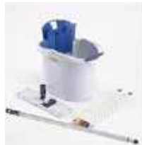
KIT ULTRASPEED MINI

REF:7037 Formato: 1ud Marca: VILEDA UD/CAJA:2