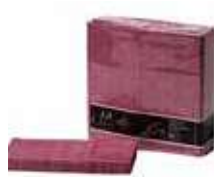
SERV. 40X40 1CP 1/8 T-SEC KANGUR BURDEO FILUM

REF:32010039 Formato:50uds Marca: G. CLASS UD/Caja:12