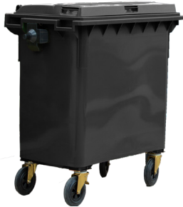
CONT.C/TAPA GRIS 4 RUEDAS

REF:75990149 Formato:1.100L Marca: MAYA UD/CAJA: